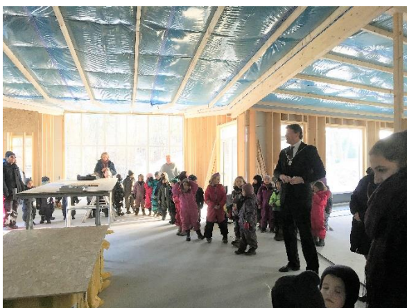
Borgmesterens tale til rejsegildet.

Klient: Børnehuset Valhalla Bygherre: Ballerup Kommune Arkitekt: Box 25 Arkitekter - Grethe Silding Periode: 2017-2018 Byggesum: 12 mill. kr.